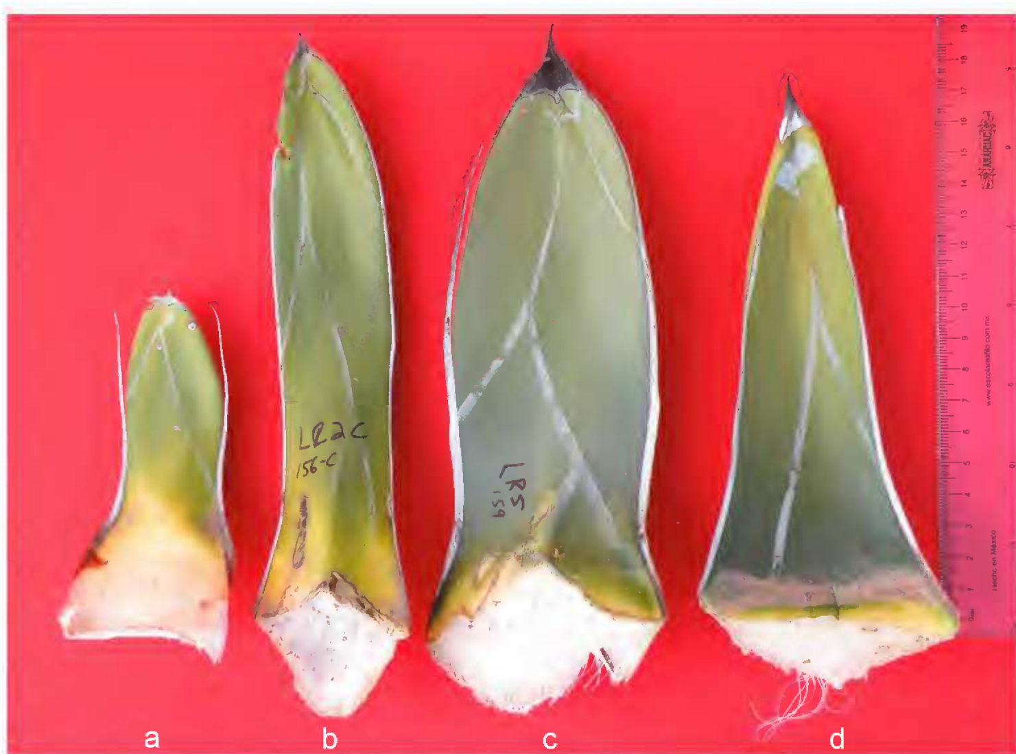
Fig. 2. Comparación de hojas de: a. Agave victoriae-reginae subsp. swoboda ; b. A. victoriae-reginae subsp. victoriae-reginae ; c. A. nickelsiae ; d. A. pintilla .

Nombres comunes: maguey noha, noa, noha.